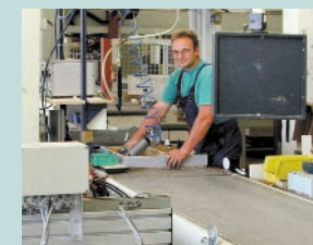
Gewerbe in Wangen.

Zum Zweck weiterer Gewerbeansiedlungen in unserer Region wurde im Jahr 1997 gemeinsam mit der Gemeinde Amtzell der Zweckverband „Interkommunales Gewerbegebiet Geiselharz-Schauwies“ gegründet.