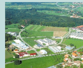
Das Gewerbegebiet in Wangen, Geiselharz-Schauwies.

Bis zum Autobahnanschluss an die A 96 – Anschlussstelle Wangen-West (Achse Ulm-Memmingen-Österreich-Schweiz) – sind es ca. 3,5 km. Von den ursprünglich etwa 29 ha stehen derzeit noch Gewerbeflächen mit ca. 3 ha zur Verfügung.