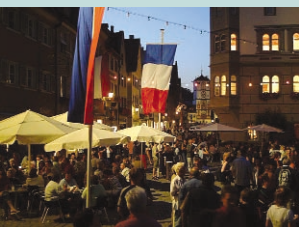
Das Herz von Wangen: Der belebte Marktplatz.

Als wirtschaftlicher, kultureller und gesellschaftlicher Mittelpunkt des württembergischen Allgäus bietet die Stadt mit seinen Ortschaften die vielfältigsten Angebote und Möglichkeiten für ein angenehmes und zukunftsorientiertes Leben und Arbeiten. Die Menschen finden hier angenehme Wohn- und Arbeitsbedingungen, die Unternehmen verfügen über ein leistungsfähiges und attraktives Umfeld.