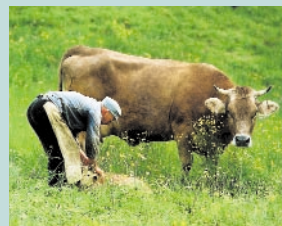
Die Umgebung von Wangen: Im Einklang mit der Natur leben.

Die Große Kreisstadt Wangen im Allgäu ist eine alte aber quicklebendige Stadt. Große Zäsuren und nicht zu Ende gedachte Brüche mit der Vergangenheit lassen sich deshalb auch nicht finden. Wangen im Allgäu ist eine attraktive Stadt mit hervorragenden Standortbedingungen und einer besonderen Lebensqualität. Mit der Eingliederung von den Ortschaften Deuchelried, Karsee, Leupolz, Neuravensburg, Niederwangen und Schomburg vergrößerte sich Wangen auf heute über 26.700 Einwohner mit einer Gemeindefläche von rund 100 km 2 .